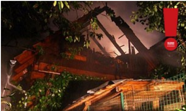
In Nassau im Bezirk Deutschlandsberg brannte nach einem Blitzschlag eine Scheune nieder

Enorme Regenmengen fielen in der Nacht auf Freitag