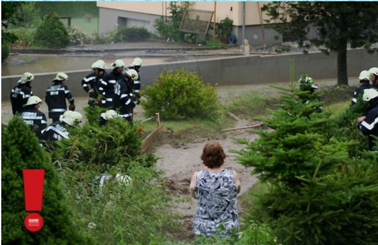
Hunderte Feuerwehrleute sind nach schweren Unwettern in der ganzen Steiermark im Einsatz

So hoch die Temperaturen in der Steiermark am Mittwoch kletterten, so stark fielen auch die Unwetter aus: Hunderte Feuerwehrleute kämpfen gegen Hagel schäden und Überschwemmungen.